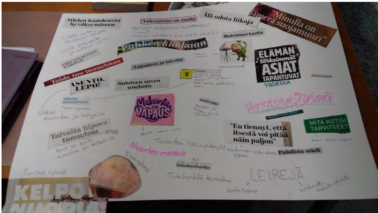
Kuva 5. Nuorten työstämät palvelujen unelmakartta.

Unelmakarttojen esittelemisen ja niistä keskustelua. Mikäli aika unelmakarttojen läpikäymiseen ei riitä, voi unelmakartat käydä läpi seuraavalla kerralla.