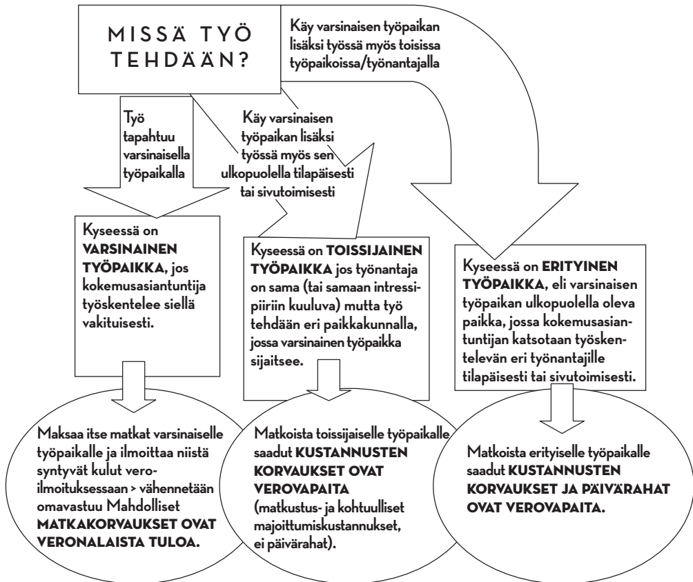
KUVA Työsuhteessa olevan kokemusasiantuntijan tehtävään liittyvät matkat ja niistä syntyvistä kustannuksista saatujen korvausten verotus