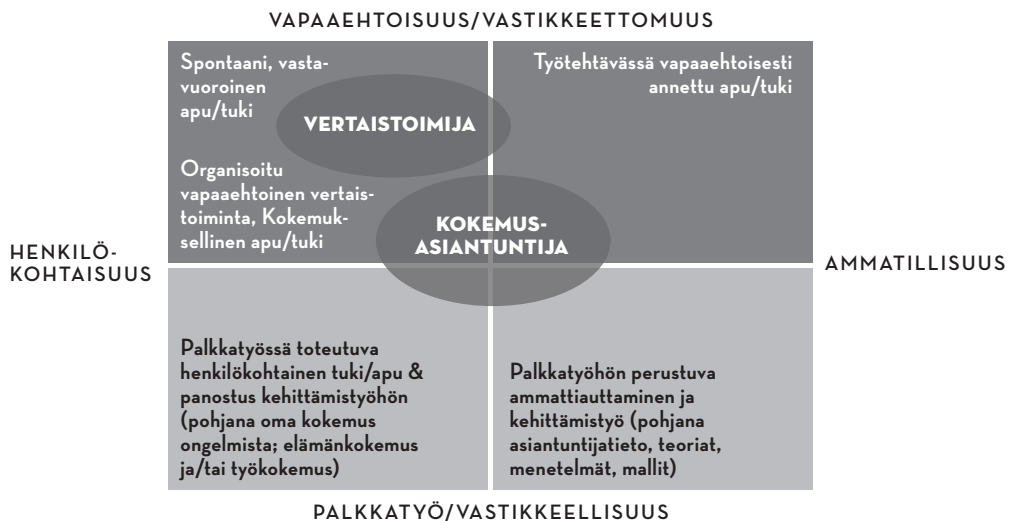
KUVA 1 Kokemusasiantuntija ja vertainen vapaaehtoistoiminnan, kuntoutumisen sekä palkkatyön rajapinnalla (Hietala 2013).

hahmotellaan seuraavan kuvan (kuva 1) avulla (Hietala 2013, luentokäyttöön tehtyä kuvaa muokattu oppaan tarpeisiin). Kuvasta käy ilmi perinteisen vertaistoiminnan henkilökohtaisuus ja tietty spontaanisuus sekä se, miten tästä lähtökohdasta annettu apu tai tuki on organisoitunakin aina vapaaehtoista ja vastavuoroista. Kokemusasiantuntijatoiminnassa siirrytään vertaistoiminnasta vapaaehtoisuuden ja henkilökohtaisuuden sekä vastikkeellisuuden/palkkatyön ja ammatillisuuden välimaastoon. Kiinnostavaksi asetelman tekee se, että myös ammattiauttajien työssä nämä samat ulottuvuudet ovat läsnä silloin, kun he kokevat tekevänsä työtä koko persoonallaan ja sydämellään. Silloin hekin toimivat henkilökohtaisen auttamishalunsa pohjalta, eivät yksinomaan palkan motivoimina. Juuri tästä voi ajatella kokemusasiantuntijoiden ja ammattilaisten yhteistyön vahvuuden nousevan; se tuo yhteen ammatillisen työn ja ihmisten keskinäisen avun, altruistisen toiminnan perinteet tavalla, joka on voinut heikentyä korostuneen järjestelmälähtöisessä toiminnassa.